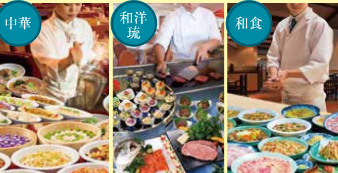
中華 飲茶&広東料理「マンダリンコート」 屋台ラーメンと県産食材を使用した飲茶&中華食べ放題

「選べるスペシャルランチバイキング」 中華・和洋琉・和食からお選びいただけます。